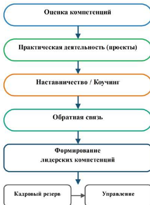
Рисунок 2. Интегрированная модель формирования лидерских компетенций в кадровом резерве 1

В этой связи совершенствование механизмов развития лидерских компетенций в кадровом резерве целесообразно рассматривать как переход от набора разрозненных HR-инструментов к целостной системе, встроенной в стратегическое управление компанией. Такая система должна обеспечивать непрерывность развития и прямую связь между формированием компетенций и управленческими задачами.