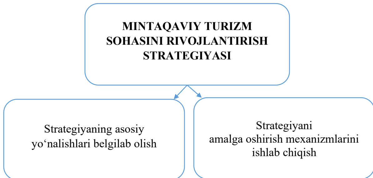
1-chizma. Mintaqaviy turizmni rivojlantirish strategiyasi elementlari 1 .

rivojlantirish strategiyasi hududning o'ziga xos tabiiy, tarixiy va madaniy imkoniyatlarini birlashtirgan holda kompleks yondashuvni talab qiladi. Mana shunday kompleks yondashuv bilan mintaqada turizmni rivojlantirishga mo'ljallangan strategiyaning asosiy yo'nalishlari va amalga oshirish mexanizmlari ajratib ko'rsatish mumkindir (1-chizma).