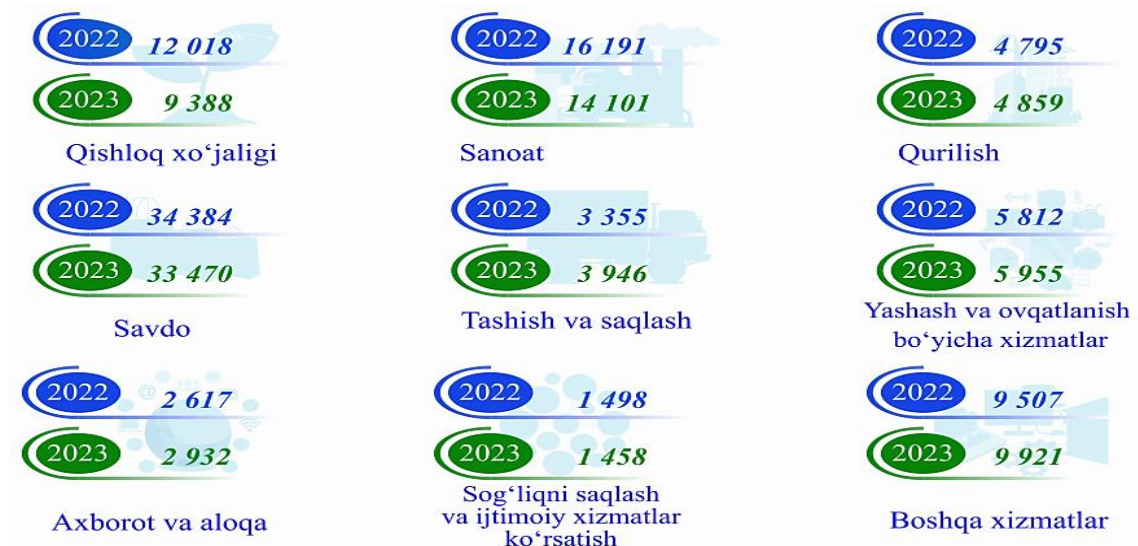
1-rasm. Iqtisodiy faoliyat turlari bo'yicha yangi tashkil etilgan kichik korxonalar va mikrofirmalar soni, birlikda (2022-2023-yillarning yanvar-dekabr oylarida) 1

• Mazkur ma'lumotlardan kelib chiqib, mamlakatda mikrofirmalar va kichik korxonalar sonini yanada oshirish uchun hududiy rivojlanish dasturlarini takomillashtirish va infratuzilmani yaxshilash zarur. Bu tadbirlar hududlararo iqtisodiy tengsizlikni kamaytirishga yordam beradi.