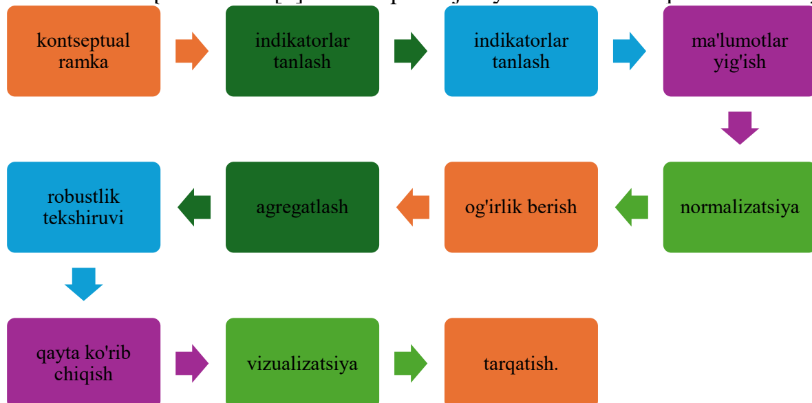
1-rasm. Indeks qurish jarayonini oʻnta bosqich[3]

OECD/JRC qoʻllanmasi [3] indeks qurish jarayonini oʻnta bosqichda tavsiflaydi: