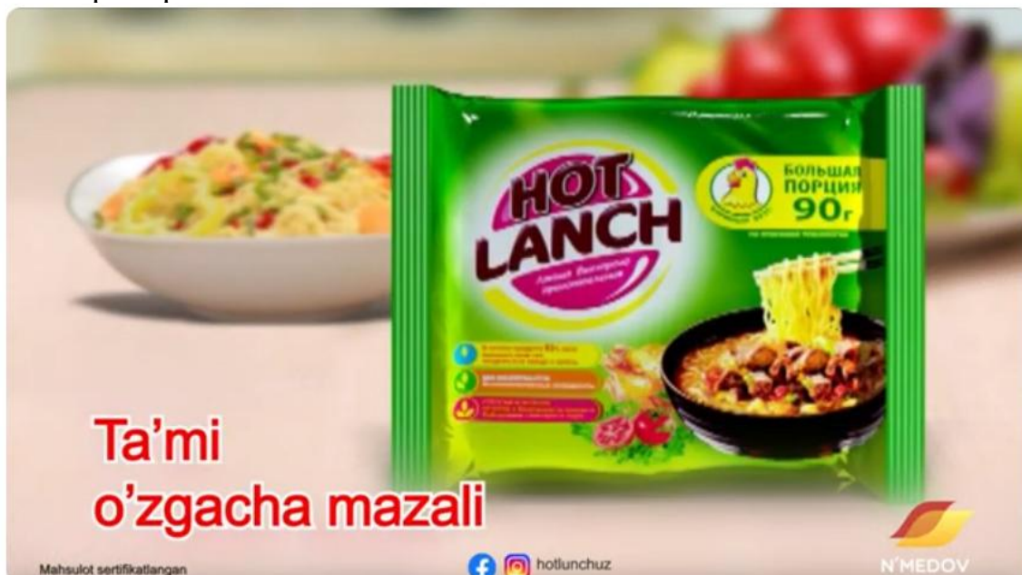
2-rasm. Hot lanch reklamasi [12]

mazali” ifodasini qo‘llash orqali boshqa raqiblarning bu ifodani qo‘llashini oldini olgan. Raqiblar istalgan boshqa ifodani qo‘llashi mumkin, ammo “Ta’mi o‘zgacha mazali”ni qo‘llay olishmaydi. Mutlaq ustunlikka ega bo‘lish mushkul bo‘lgan tovar kategoriyalarida ifoda jihatidan ustun pozitsiyani egallab, xaridorlarga psixologik ta’sir ko‘rsatish maqsad qilinadi.