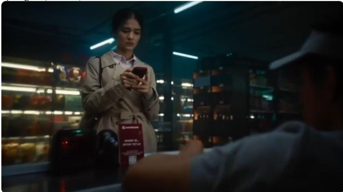
8-rasm. Anorbank reklamalari [17]

7. Affektiv/hissiy strategiya. Anorbank reklamalarida bank tomonidan taklif etilayotgan xizmatlari tomoshabinlar hissiyotlariga ta'sir qilish orqali amalga oshirilyapti. Ba'zi reklamalarida kulgu, ba'zilarida qo'rquv hissini uyg'otish orqali taklif etilayotgan xizmatni tanitishga, unga bo'lgan qiziqishni orttirishni maqsad qilgan. Masalan, "Anor nasiya" kartasi reklamasida super marketda to'lov qilmoqchi bo'layotgan qiz o'z kartalarida pul mablag'i yetishmaganligi tufayli to'lay olmaslik qo'rquvi yuzida namoyon bo'ladi. Birin-ketin ilovadagi hamma kartalariga qarasa hech bir kartasida pul yo'q edi. Nima qilishini bilmay oxirida Anor nasiya kartasiga qarasa, u yerda mablag' borligi qizni xijolatli vaziyatdan qutqarib, yuzida tabassum paydo bo'lishiga olib keladi. Bunday mazmundagi reklama orqali shu singari qo'rqinchli va uyatli vaziyatlarda qolib ketmaslik uchun Anor nasiya kartasini foydalanish tavsiya etilyapti. Ya'ni qo'rquv hissiyotini uyg'otish orqali xizmatdan foydalanishga undash maqsad qilingan (8-rasm).