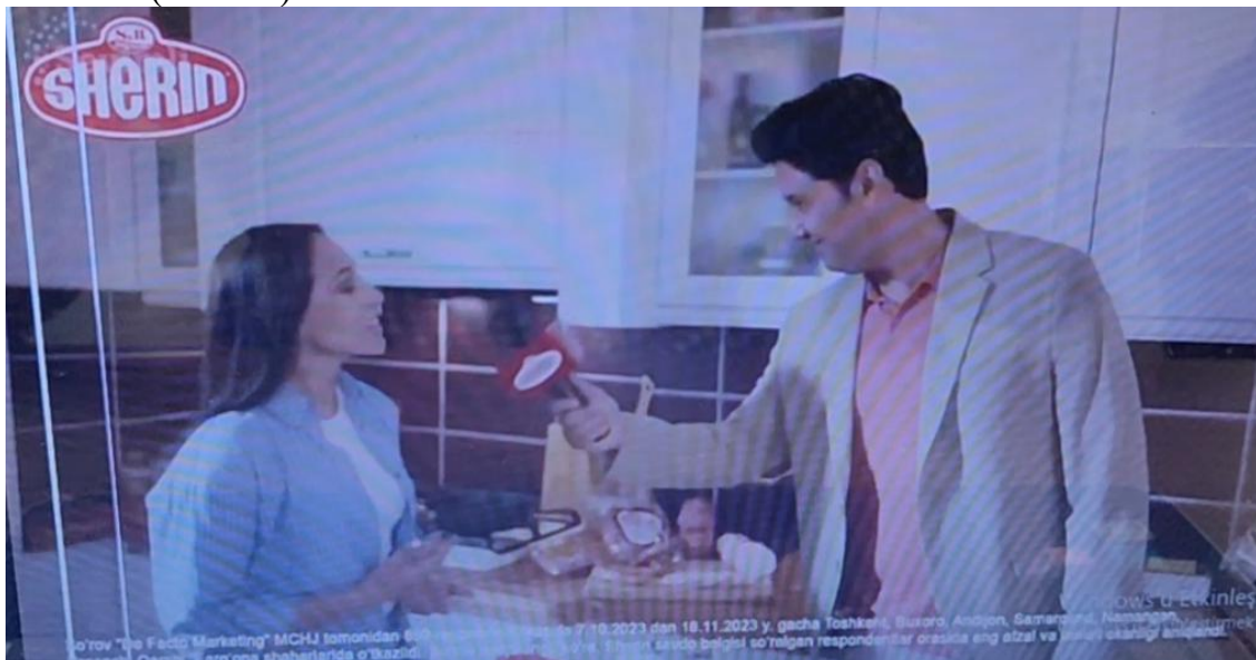
5-rasm. “Har bir uyda Sherin” reklamasi [14]

4. Brend imiji strategiyasi. Sherin brendining “Har bir uyda Sherin” reklamasi brend imijini yaxshilash uchun “Aytishlaricha iste’molchilarimiz Sherinni muntazam tanlashadi” matni bilan turli iste’molchilarni ziyorat qilib, ular Sherin brendining turli kolbasalarini ishlatishayotganligini ko’rsatyapti. Ko’pchilik Sherin kolbasalarini iste’mol qilishayotganligini va yaxshi ko’rishlarini reklamada ma’lum qilishlari, bu brendning imijini oshirishga qaratiladi. Bunday mazmundagi reklama tomoshabin ongida “Ko’pchilik Sherinni tanlar ekan, demak sifati yaxshi ekan” - degan psixologik xulosani keltirib chiqaradi. Bu esa o’z navbatida brend imijini oshirishga yordam berishi mumkin (5-rasm).