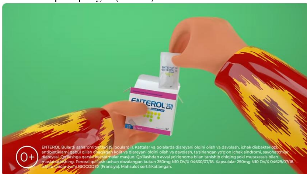
7-rasm. Enterol dorisining “Diareya keldi. Diareya ketdi” reklamasi [16]

6. Rezonans strategiyasi. Diareyaga qarshi Enterol dorisini reklama qilishda o‘zbek milliylik elementlariga murojaat qilingan. Reklamada ota-ona va qiz obrazlari asosiy qaxramonlar sifatida animatsion shaklda aks ettirilgan. Ona — adrasda, ota — chopon-do‘ppida, qiz – do‘ppida va milliy ko‘ylakda, sochlari jamalak qilib o‘rilgan. Milliy kiyim va milliy muhitdagi an’anaviy o‘zbek oilasida qorin og‘riq muammolari boshlanganida Fransiyada ishlab chiqarilgan Enterol dori vositasi yaxshi yechim tarzida taklif qilinyapti. Mazkur reklamada reklama obyekti o‘zbek milliyligi bilan rezonanslash “to‘lqinlashtirish” orqali amalga oshirilgan. Boshqacha qilib ifoda qilinganda, Enterol dori vositasi o‘zbek milliyligi va yashash tarzining bir parchasi o‘laroq tasvirlanib, mahalliy bozorda bu dorining mijozlar tomonidan yaxshiroq qabul qilinishiga erishish maqsad qilingan (7-rasm).