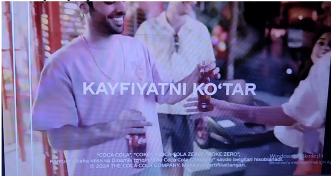
6-rasm. Coca-colaning “Kayfiyatni ko‘tar” reklamasi [15]

Coca cola kayfiyatni ko‘taruvchi, yoshlik jo‘shqinligini beruvchi ichimlik sifatida qabul qilinishi maqsad qilingan.