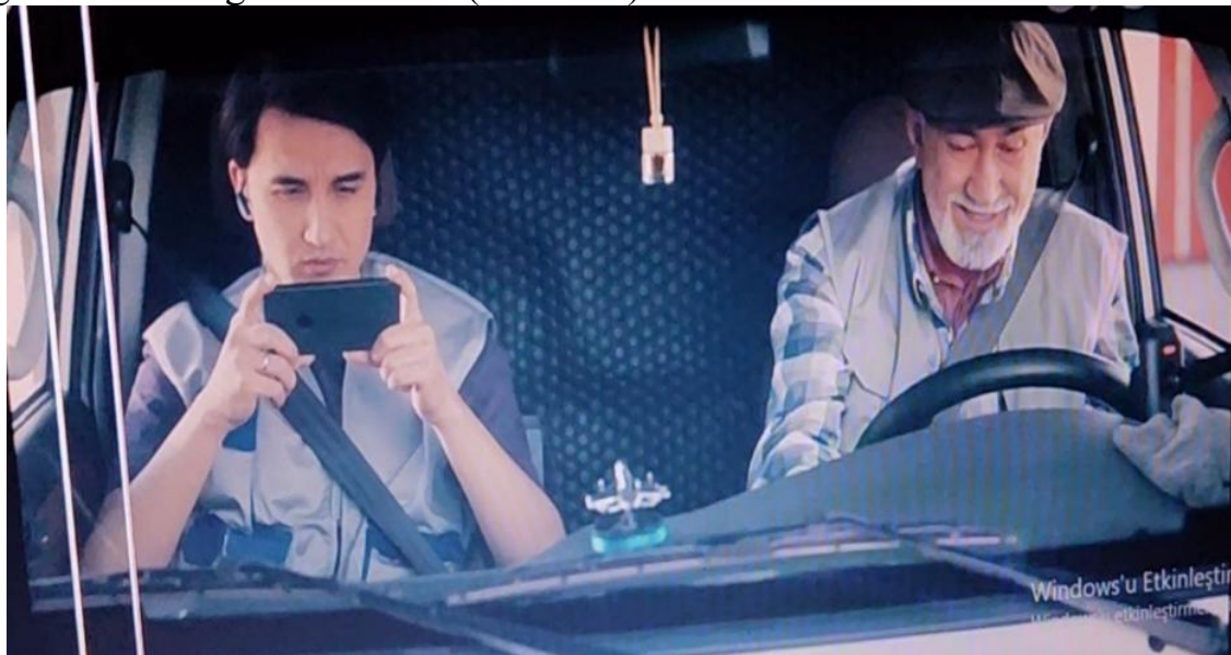
3-rasm. Humans mobil operatorining “Super VIP” tarifi reklamasi [13]

3. Noyob sotish taklifi strategiyasi. Humans mobil operatori “Super VIP” tarifi reklamasi noyob sotish taklifini qildi. Reklamada cheksiz internet va cheksiz daqiqalar atigi 45000 so‘mga taklif qilinyapti. Bu yerdagi noyob taklif tarifning juda arzonligi va cheksizligi hisoblanadi (3-4-rasm).