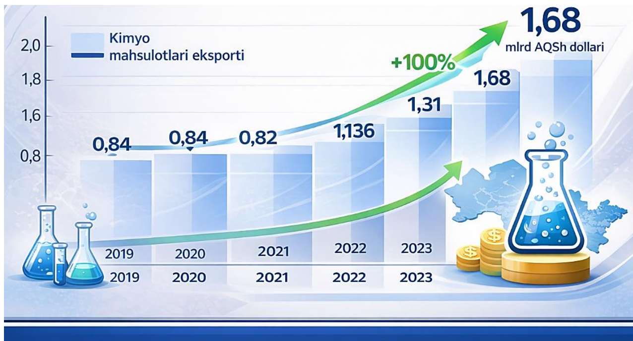
1-rasm. 2019–2024-yillarda O‘zbekiston kimyo mahsulotlari eksporti dinamikasi (mlrd AQSh dollari) 1

1-rasmdan ko‘rinadiki, 2019–2020-yillarda O‘zbekiston kimyo mahsulotlari eksporti hajmi nisbatan barqaror darajada saqlanib qolgan bo‘lib, 2021-yildan boshlab ushbu ko‘rsatkichda izchil o‘shish tendensiyasi kuzatilmoqda. Xususan, 2021–2024-yillar oralig‘ida kimyoviy mahsulotlar eksporti hajmi qariyb ikki baravarga yaqin oshib, 2024-yilda 1,68 mlrd AQSh dollariga yetgan. Mazkur ijobiy dinamika kimyo sanoati korxonalarida ishlab chiqarish quvvatlarining kengaytirilishi, mahsulot nomenklaturasining diversifikatsiyasi hamda tashqi bozorlarda talab yuqori bo‘lgan kimyoviy mahsulotlar ulushining ortib borishi bilan izohlanadi. Shu bilan birga, eksport hajmidagi o‘shish innovatsion texnologiyalarni joriy etish va ekologik talablarni hisobga olgan holda ishlab chiqarishni modernizatsiya qilish jarayonlarining jadallashgani bilan ham bog‘liqdir.