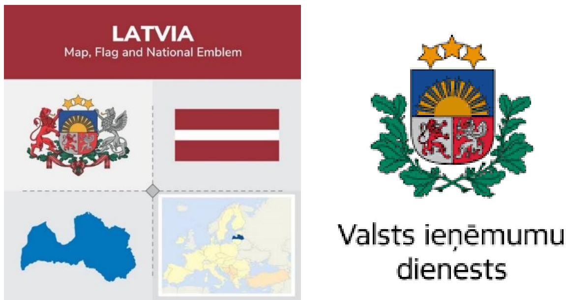
1-rasm. Latviya Davlat daromadlari xizmati (Valsts ieņēmumu dienests, VID) 2

solliq to'lovchi Elektron deklaratsiya tizimi (EDS) orqali o'z reytingini va uni shakllantirishda foydalanilgan ko'rsatkichlar tafsilotlarini bilish huquqiga ega bo'ldi 1 .